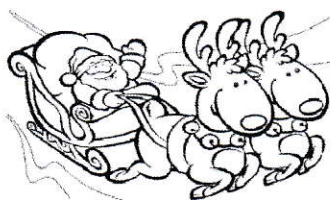
ÜDVÖZLETTEL: A BARANGOLÓ MIKULÁS

A Barangoló Közhasznú Egyesület mikulásgyára örömmel állt rendelkezésre, nem csak a kiszállításban, de az összegyűjtésben, válogatásban és a csomagolásban is segítünk minden rendelkezésünkre álló forrással. A Barangoló Mikulás akción az év egyik legkomolyabb jótékonyági és önkéntes eseménye egyesületünk működése során. Az egy hónapon át összegyűjtött játékok, könyvek, édességek válogatás és csomagolás után személyre szabottan kerülnek a végegyházi gyermekekhez, bearanyozva ezt a téli estét. Az akción, bár ez nem elsődleges célja, de szolgálja a környezetünk óvását is, hiszen a játékok, könyvek újrahasznosítása csökkenti a környezeti terhelést, és az elmúlt év óta az ajándékokat sem nejlonzacsókba helyezük, hanem a Mikulás által jóváhagyott papírzacsókba. A mai napon már csak ki kellett kézbesíteni a Barangolós Mikulásnak